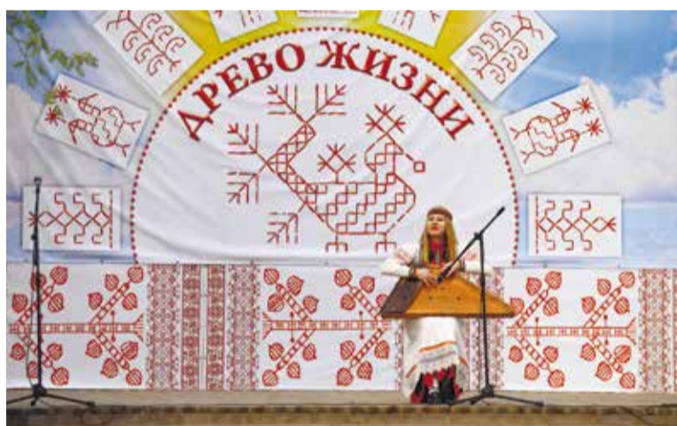
Праздник вепсов «Дерево жизни» в селе Винницы