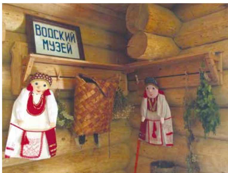
Музей водской культуры в деревне Лужицы

градской области проводятся курсы по изучению ижорского языка.