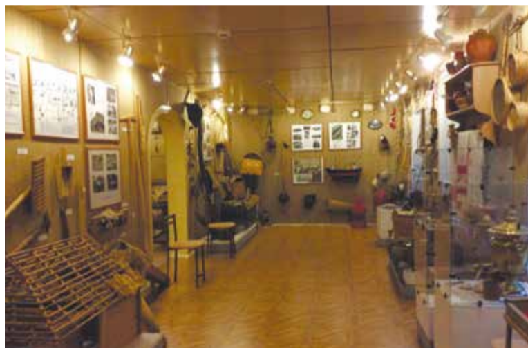
Музей ижорской культуры в Вистино

Фольклор ижоры известен по устному народному творчеству – песням-рунам сказителей-рунопевцев. Этот небольшой по численности народ сохранил в своей памяти общий с карелами и финнами эпос, отдельные части которого оказались известны только ижорским рунопевцам. Ижорский язык включен в 2009 году ЮНЕСКО в Атлас исчезающих языков мира как «находящийся под значительной угрозой исчезновения». Для сохранения культурного наследия народа создан краеведческий ижорский музей в деревне Вистино. Там же, в Вистино, молодежная фольклорная группа записывает у старожилов и исполняет ижорские песни. В Центре коренных народов Ленин-