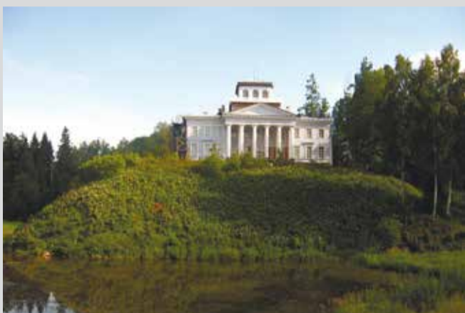
Достопримечательности Ленинградской области. Рождествено